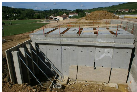
VUE DE DESSUS DES PIEDROITS